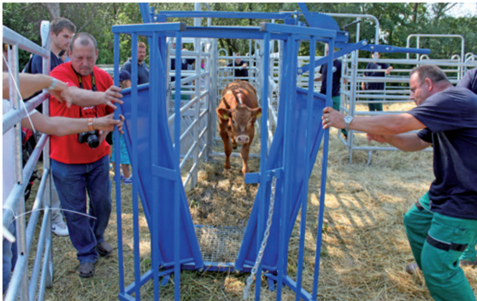
Mobilné oceľové hradenie umožňuje ľahkú manipuláciu a bezpečnú prácu so zvieratami v pastevných podmienkach.

„Ide o manipulačnú a naháňaciu súpravu, ktorá umožňuje ľahké zachádzanie so zvieratami pri zhromažďovaní, triedení stáda,