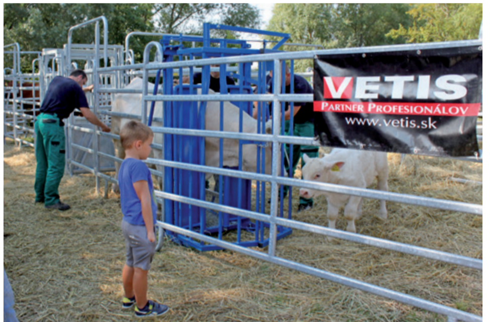
Fixačné čelo opatrené predným košom – ak zvierat vojde hlavou do koša je spokojné, pretože cez neho vidí, prípadne vidí aj na svoje teliatko.

bránka je zaistená. Ak sa prvé zvierat popoženie cez